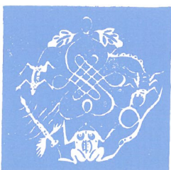
中国人の描いた五毒の図

五月五日に「ちまき」を食べるのには、中国で政治家屈原の命日に、ちまきを河に投げて弔う慣しが、わが國に伝わったものである。菖蒲を飾ったり、これを風呂に入れるのは、その香気と虫よけの薬効によって、邪気を斥けて五月五日の厄を払う意味である。中国では菖蒲は五毒を払い、同時に「五毒が協力して人を安んずれば百毒に勝つ」という。五毒とは、へび・がま・さそり・とかげ・むかでの毒のことである。鐘馗の人形を飾るのも魔除けの意味である。(リ参照)