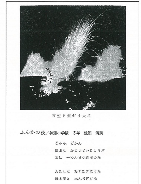
◀第3巻「三宅島噴火災害誌」より