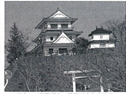
写真1 浦谷要害の模範天守と太鼓堂 (左=模範天守、右=太鼓堂)

へ流れる江合(浦谷)川左岸の崖上に位置する。要害は南北に細長い本丸が、本丸の東から南にいたる細長い郭が二ノ丸である。本丸の御殿は南北に細長く、南東端に太鼓堂が存在した(註6)。